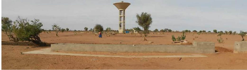
Abreuvoir et château d'eau à Wendou Diamo (Aicha 1)