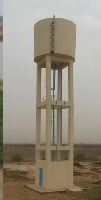
Unité de potabilisation et château d'eau de Diagambal (Aicha 1)