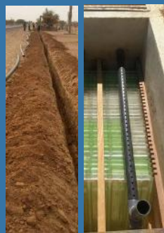
Extensions de réseau et renforcement d'une station de potabilisation