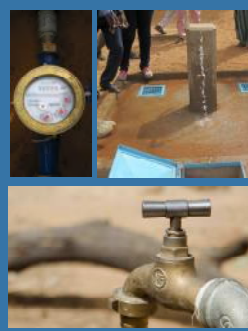
Bornes fontaines, abreuvoirs et 1 000 branchements particuliers