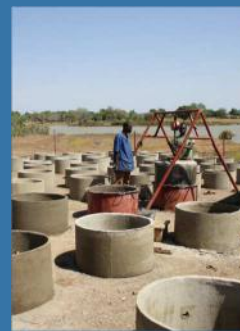
Appui d'opérateurs locaux à la production et vente de toilettes