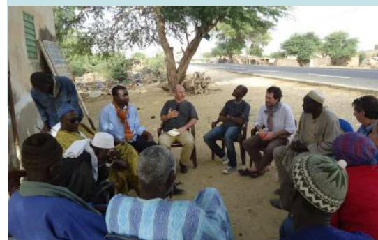
Réunion avec l'ASUREP de Diagambal