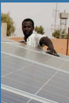
Étude de référence sur le pompage solaire