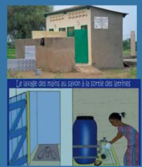
Blocs sanitaires et sensibilisation scolaire